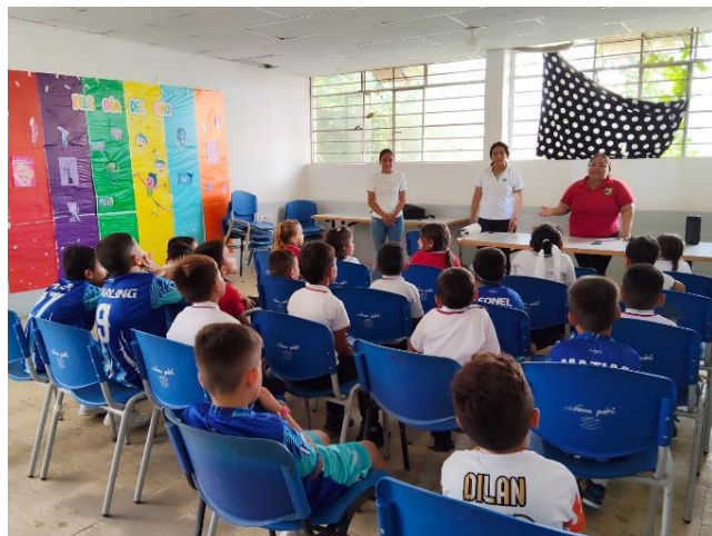
Capacitación Educación Ambiental Municipio de Tibú