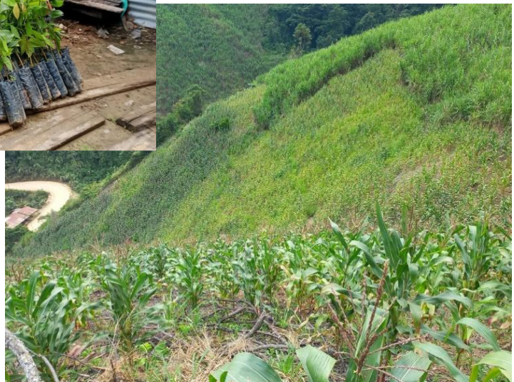
Siembra de árboles de la especie forestal Abarco