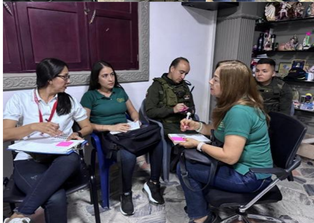
CEAM Municipio de Sardinata