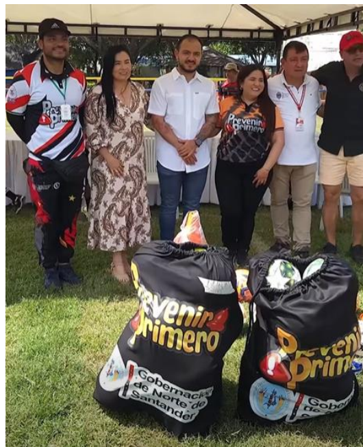
Entrega de dotación y articulación con alcaldes municipales.