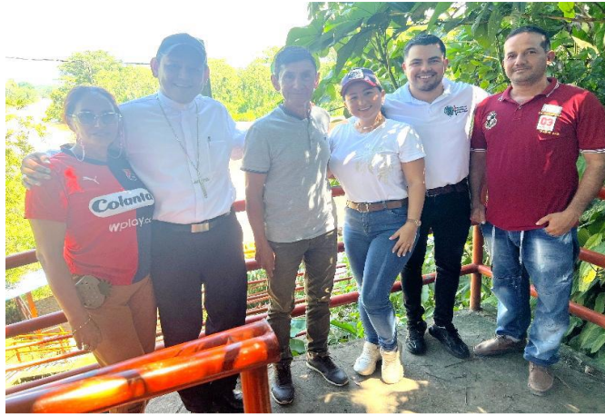
Acompañamiento para la formulación de proyectos de reforestación en el municipio de Tibú