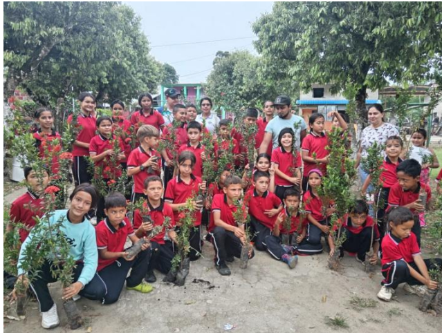
Sembratón de Árboles Escuela Tres bocas Municipio de Tibú CEAM Municipio