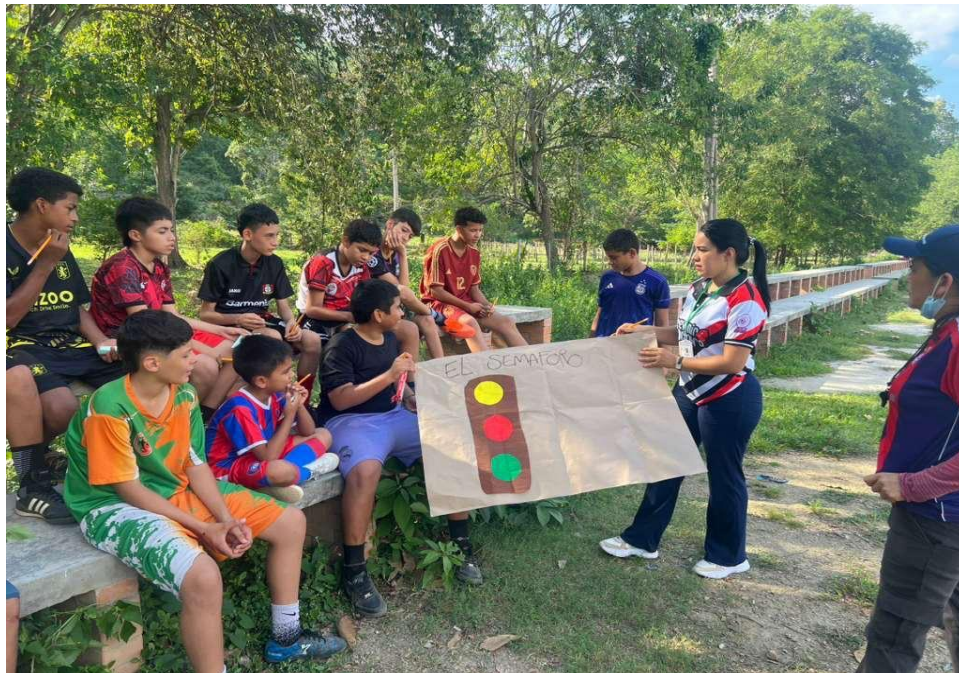
Escuelas de convivencia.