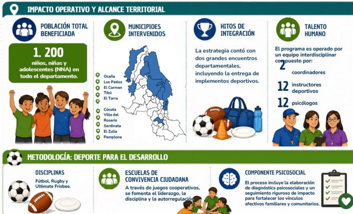
Ficha técnica, resumen de la estrategia en el Departamento.