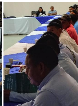
Resguardo Catalaura Resguardo Barí Municipio de Tibú-corregimiento de la Gabarra