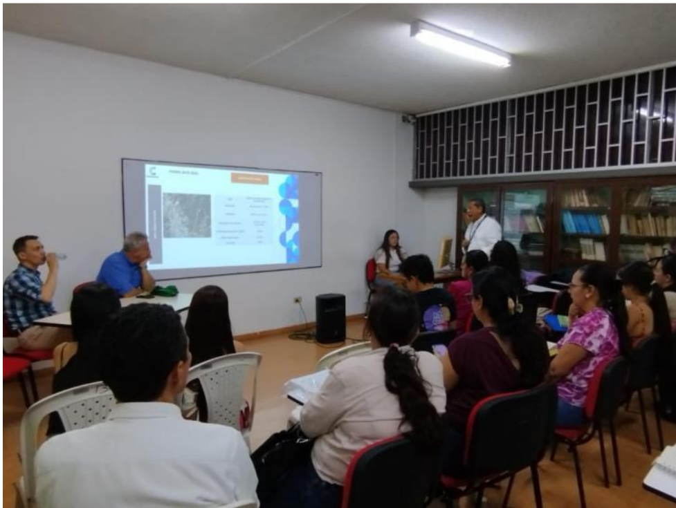
Foro de PGIRS y Economía Circular Municipio de Ocaña