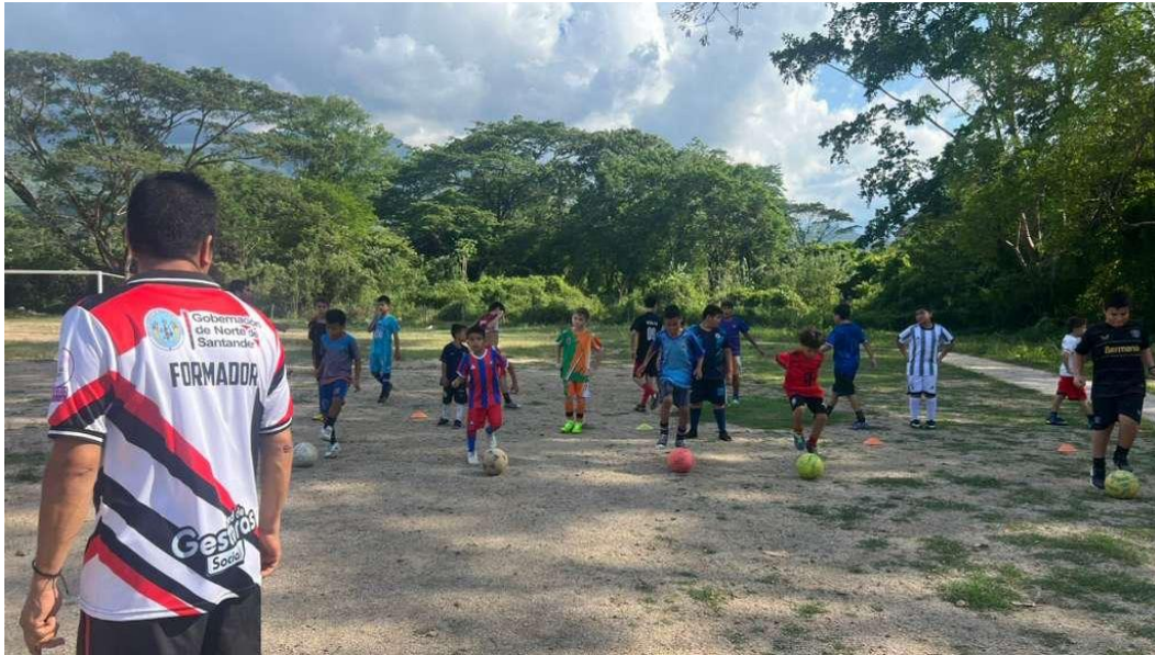
Juegos cooperativos, fútbol y rugby.