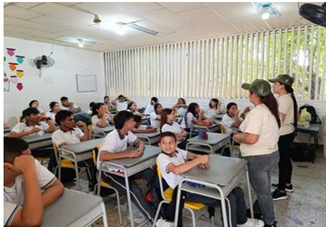
Capacitación Biodiversidad I.E Nuestra Señora de las Mercedes Municipio de Sardinata