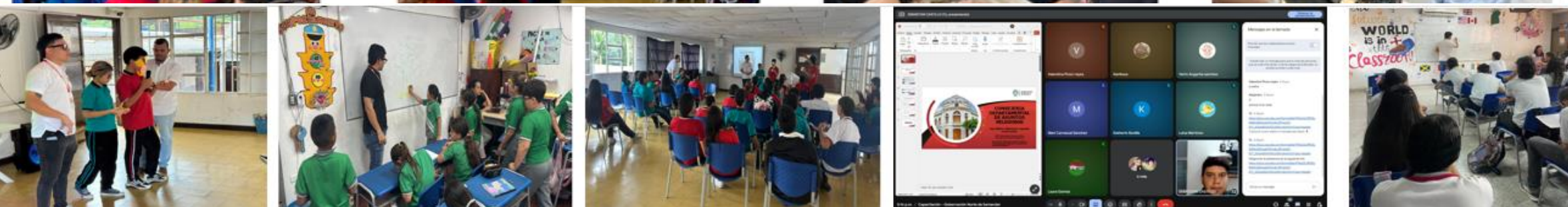
683 Proyectos cofinanciados por el Gobierno Nacional y el Gobierno Departamental de Cauca, programas que benefician a las comunidades que atienden