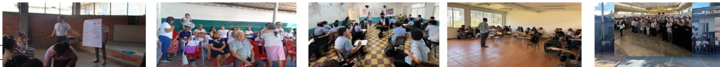
681 Personas beneficiadas en servicios de educación para el trabajo y desarrollo humano. (Espacios de divulgación y promoción de los valores y principios éticos y morales (Talleres, seminarios y foros))