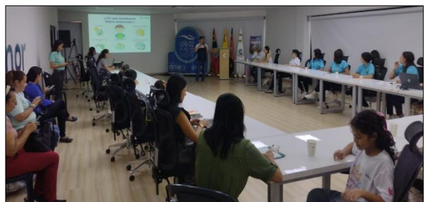
Concurso Piensa Verde- Agenda Académica Ecokids 20/09/2024