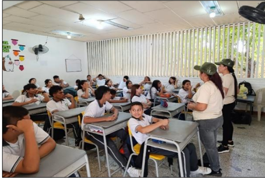
Capacitación Colegio Nuestra Señora de Las Mercedes Sardinata, 18/09/2024.

Las capacitaciones se realizaron en 10 municipios: Cúcuta, Ábrego (urbano y rural), Villa del Rosario, Bucarasica, Los Patios, Puerto Santander, Toledo, Salazar, Sardinata y Ocaña.