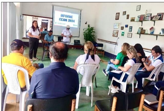
Primera sesión CEAM Chinácota, 11/07/2024

La Secretaría de Medio Ambiente, Recursos Naturales y Sostenibilidad elaboró una línea base de los 40 CEAM (Comités de Educación Ambiental Municipal), con información que permite un mayor seguimiento y acompañamiento, orientando la planificación y ejecución de acciones de educación ambiental que dinamizan y consolidan la Política Nacional de Educación Ambiental y el Plan de Educación Ambiental Departamental.