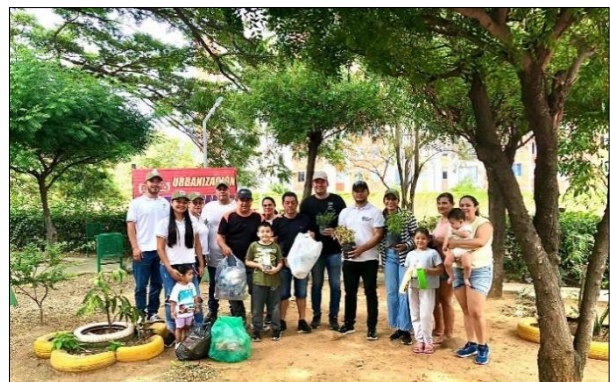
Apoyo CEAM Los Patios, 17/08/2024