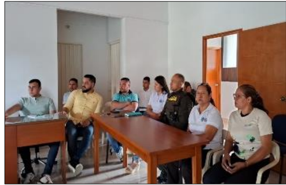
CEAM Bucarasica, 26/09/2024

META 822 Meta cuatrienio: Capacitar a 20,000 personas para potenciar la apropiación del conocimiento y el diálogo de saberes asociados a la conservación de los ecosistemas estratégicos y la biodiversidad.