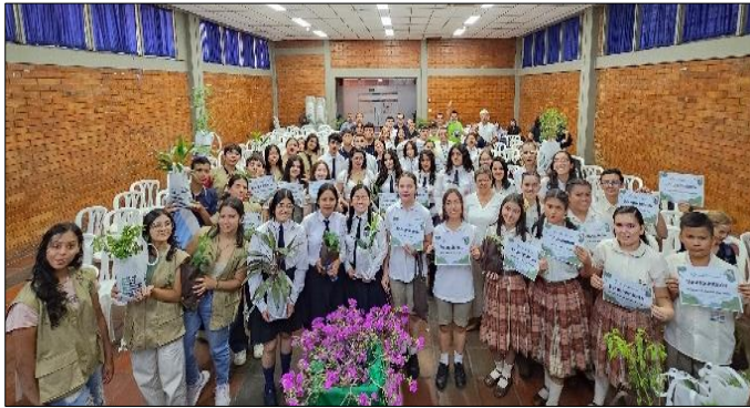
Apoyo II Encuentro Ambiental Calasancio, Cúcuta, 22/08/2024

Municipios con activación de CEAM: Tibú, Sardinata, El Tarra, San Cayetano, Bucarasica, Cúcuta, Toledo y Puerto Santander.