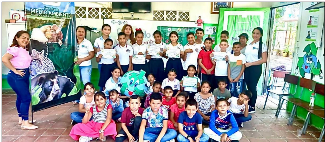
Acto de clausura Proyecto “Copa Ambiental”- Vereda Oripaya, Municipio de Cúcuta, 30/09/2024.