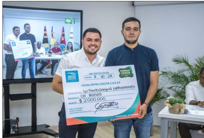
Premiación Concurso Piensa Verde Categoría Ekokids, 08/10/2024.

META 821 Meta cuatrienio: Implementación de cuatro estrategias educativo-ambientales y de participación.