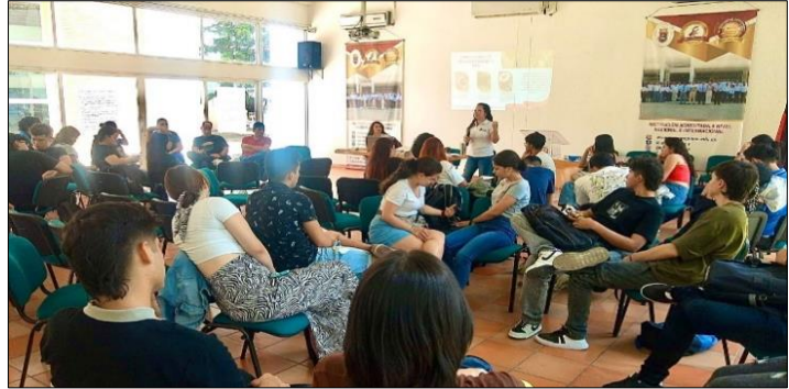
Capacitación COP 16, Universidad de Pamplona, sede Villa del Rosario, 29/08/2024.