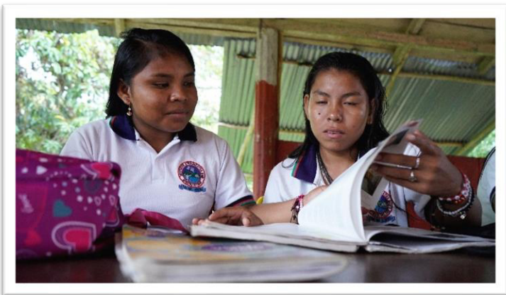
Estudiantes de la Institución Etnoeducativa Uwa Izqueta

INSTITUCIÓN ETNOEDUCATIVA BARI en el municipio de Tibú, CENTRO ETNOEDUCATIVO RURAL YERARO MIMAY SASHIYI municipio de Convención, INSTITUCIÓN ETNOEDUCATIVA RURAL IKI BOGYIRA MIMAY. El Carmen CENTRO ETNOEDUCATIVO RURAL CAMARIGCAYNA BARI municipio de Teorama, INSTITUCIÓN ETNOEDUCATIVA U WA IZQUETA (SEGOVIA) en el municipio de Toledo