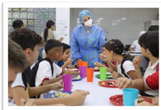
Estudiantes beneficiarios del municipio de Los Patios