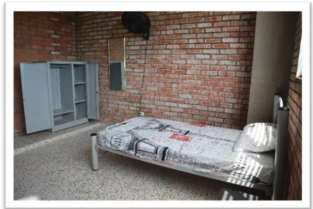
Visita inspección internado La Gabarra

Meta cuatrienio 196: 2100 Personas beneficiarias de ciclos lectivos especiales integrados.