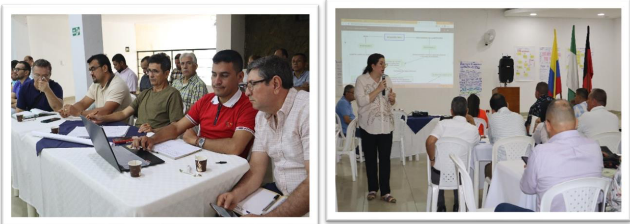
Encuentros de rectores y directores de los establecimientos educativos provincia Ocaña

Indicadores de deserción educativa. Ocaña, Abrego, Convención, El Carmen, La Playa, San Calixto, Teorama, Villa del Rosario, Tibú Sardinata Herrán, Sardinata Toledo Pamplona