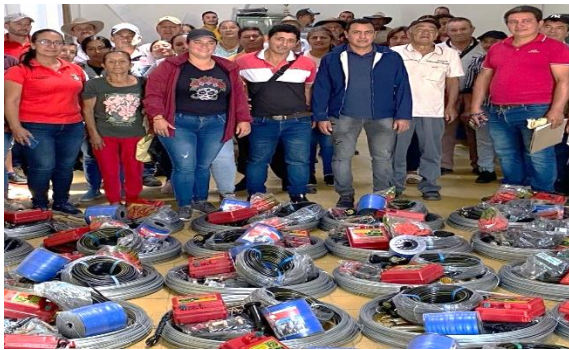
Entrega de Insumos Productivos Alianza Ganadería Asoprodara