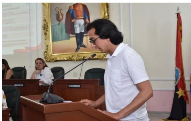
Sustentación PDEA ante Honorable Asamblea