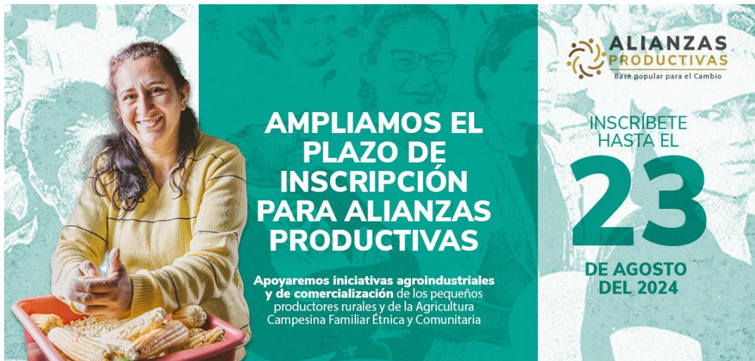
Imagen alusiva al Programa Alianzas emitida por parte del Ministerio de Agricultura y Desarrollo Rural