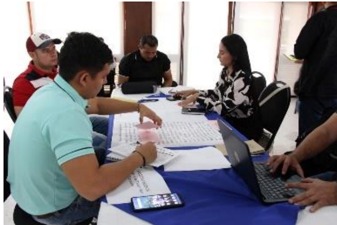
Espacio de participación territorial para la estructuración