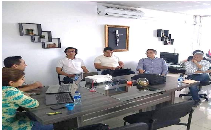
Presentación de lineamientos por parte de la Agencia de Desarrollo Rural para formulación