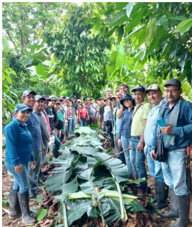
Escuela de Campo Agrícola Alianza Cacao Asocommulcat