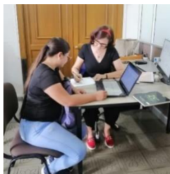
Visita secretaria de las Tic