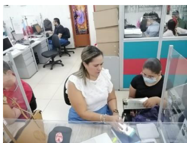
Visita secretaria de Hacienda