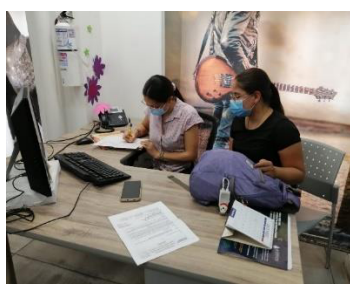
Visita secretaria de Cultura