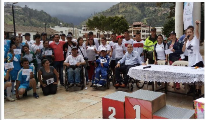
Carrera Atlética de la Inclusión – Municipio de Pamplona