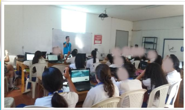
Municipios de Bóchamela colegio Andrés Bello