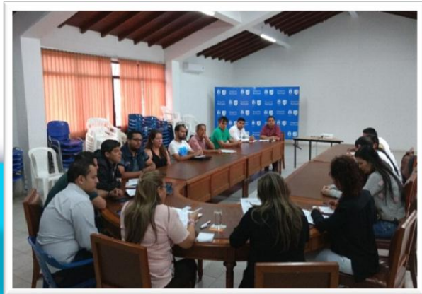
Comité municipal De Discapacidad - OCAÑA