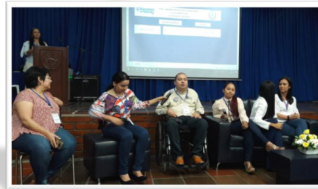
Capacitación en derechos y deberes - UDES