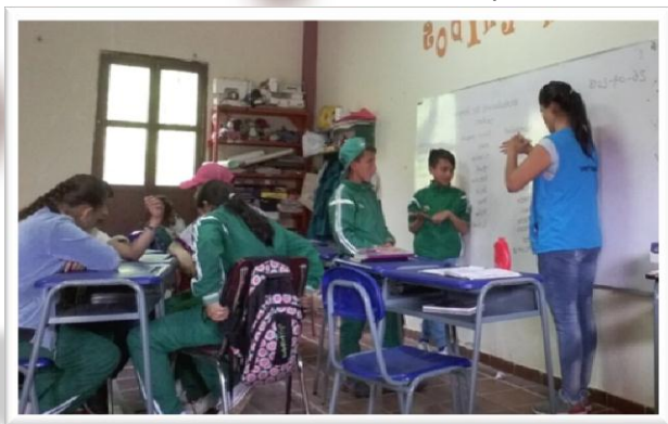
Municipio de Pamplona – colegio El provincial