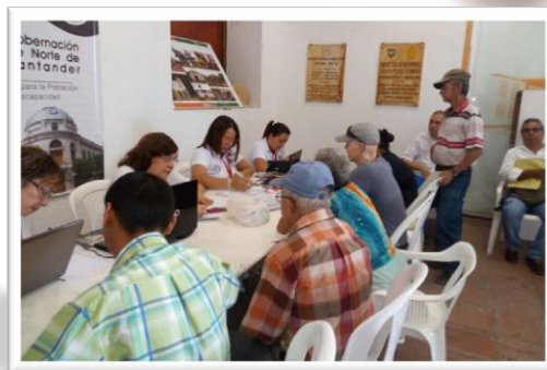
RLCPD San José de Cúcuta - Norte de Santander