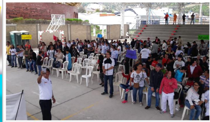
Celebración día de la Discapacidad 2017 – Municipio de Pamplona