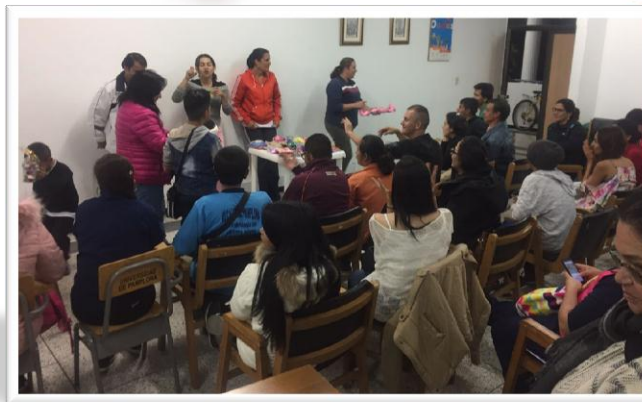
Capacitación - Municipio de Pamplona