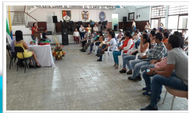
Capacitación en derechos y deberes - Municipio de Duranía