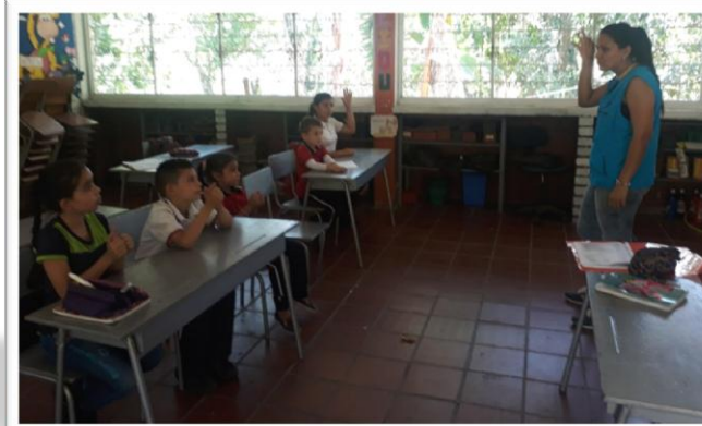
Municipio de Tibu – institución educativa integrada Colpetrolea