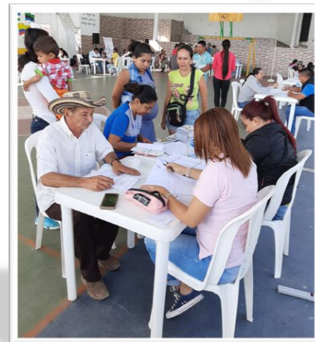
RLCPD Municipio de Teorama - Norte de Santander