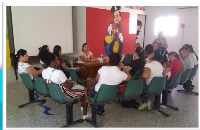
Capacitación – Padres de niños con discapacidad