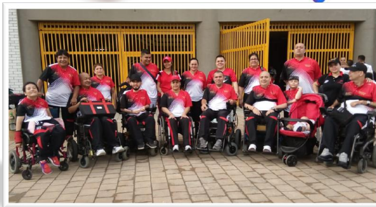
Equipo de BOCCIA – NORTE DE SANTANDER