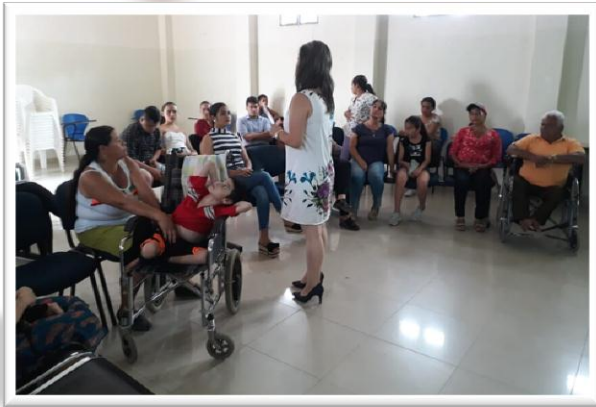
Comité municipal De Discapacidad - ABREGO