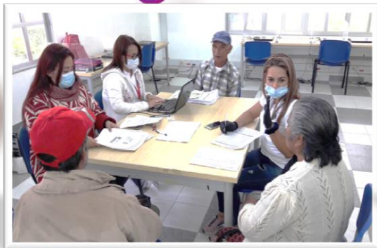
RLCPD Municipio de Herrán - Norte de Santander