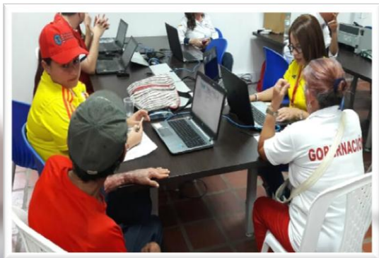
RLCPD Municipio de Puerto Santander - Norte de Santander