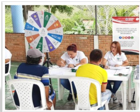
RLCPD Municipio de San Calixto - Norte de Santander