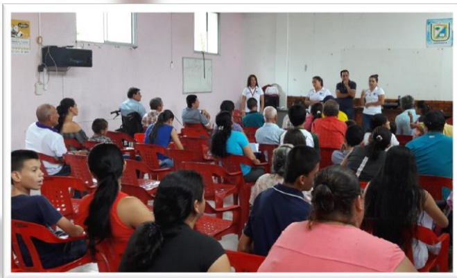
Capacitación - Municipio de Sardinata