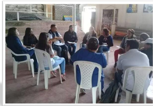
Comité municipal De Discapacidad - MUTISCUA