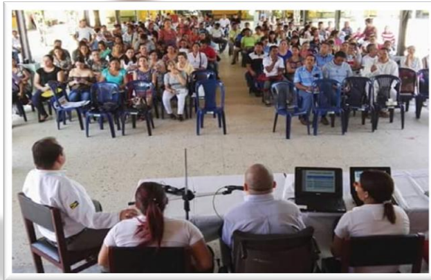
Capacitación en derechos y deberes - Municipio de Tibú